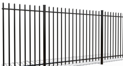
ORION PREMIUM / ARENA PREMIUM