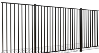
VESTA PREMIUM / TYRO PREMIUM

Les prix sont valables en coloris : ● Gris 7016, ● Vert 6005, ● Noir 9005, ○ Blanc 9010.